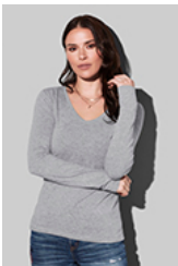
ST9720 Claire V-neck Long Sleeve