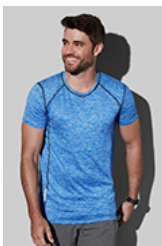
ST8840 Recycled Sports-T Reflect