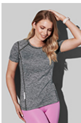
ST8940 Recycled Sports-T Reflect