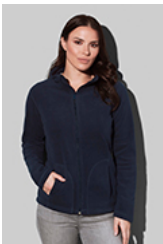
ST5100 Fleece Jacket