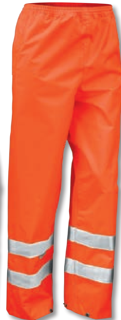
FLUORESCENT ORANGE (811)