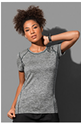
ST8940 Recycled Sports-T Reflect