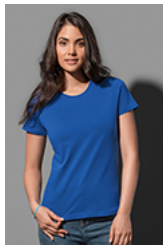
ST2620 Classic-T Organic Fitted