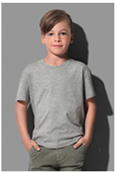
ST2220 Classic-T Organic Kids