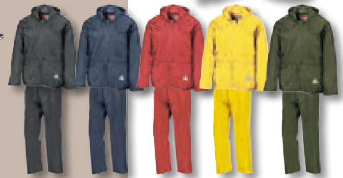
BLACK (BLK) NAVY (289) RED (200) YELLOW (388) OLIVE GREEN (5743)