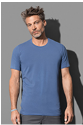
ST9600 Clive Crew Neck