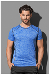
ST8840 Recycled Sports-T Reflect