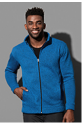
ST5850 Knit Fleece Jacket