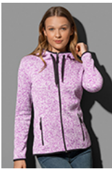
ST5950 Knit Fleece Jacket