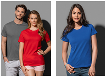
ST2020 Classic-T Organic