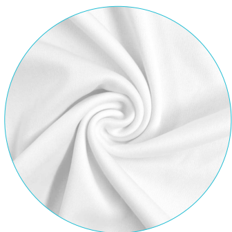
A | Single jersey polyester