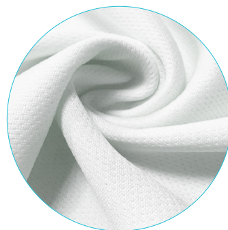
C | Coolmax® micro bird eye